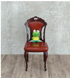
当金庫公式キャラクター「がまちゃん」が撮影を体験

「ウエディングに特化した専用フォトスタジオ」にて撮影を行います。衣裳は一般のフォトスタジオのような撮影用の衣裳ではなく、実際の結婚式で使用する本物の衣裳を撮影時に使用しますので、結婚式当日のイメージを膨らましながら撮影をお楽しみいただけます。